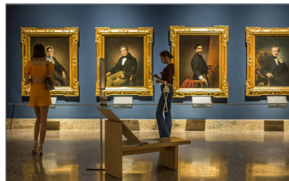
5. Pinacoteca di Brera Sala 37