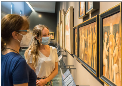
4. L'allestimento in sala 10 degli Angeli cantori e musicisti di Bernardo Zenale