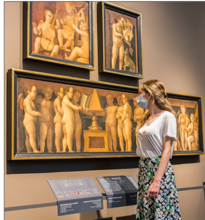
2 L'allestimento in sala 10 degli Angeli cantori e musicisti di Bernardo Zenale