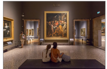
6. Pinacoteca di Brera Sala 31