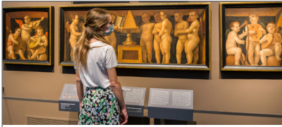
1. L'allestimento in sala 10 degli Angeli cantori e musicisti di Bernardo Zenale