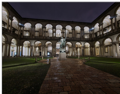
1. Pinacoteca di Brera, cortile d'onore illuminato