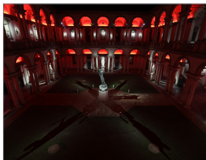
4. Pinacoteca di Brera, cortile d'onore illuminato © Foto di Andrea Cherchi - 2021