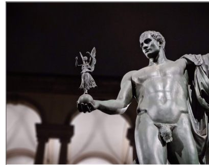
3. Pinacoteca di Brera, cortile d'onore illuminato