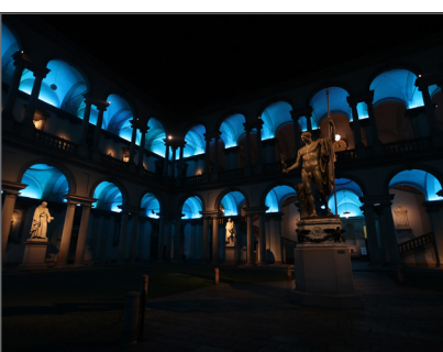
5. Pinacoteca di Brera, cortile d'onore illuminato