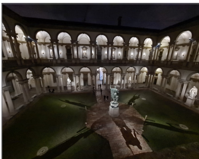
2. Pinacoteca di Brera, cortile d'onore illuminato