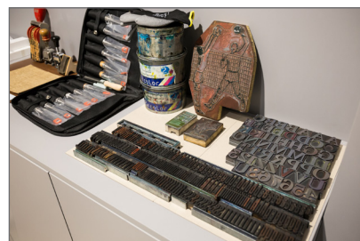
7. Il nuovo spazio educativo all'interno della Biblioteca Nazionale Braidense. Dettaglio degli strumenti necessari per le attività didattiche e i laboratori che riguarderanno anche la tipografia, la calcografia e la legatoria