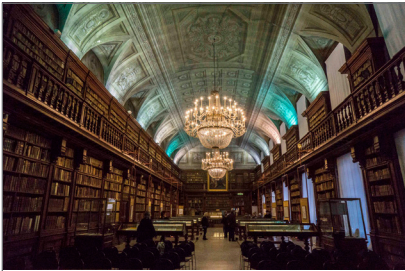
1. Biblioteca Nazionale Braidense sala Maria Teresa