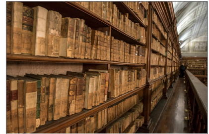
3. Biblioteca Nazionale Braidense sala Maria Teresa