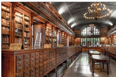
4. Biblioteca Nazionale Braidense