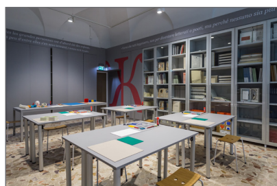
8. Il nuovo spazio educativo all'interno della Biblioteca Nazionale Braidense