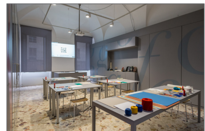
6. Il nuovo spazio educativo all'interno della Biblioteca Nazionale Braidense