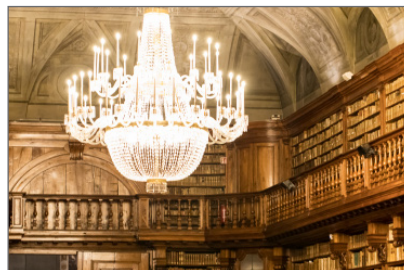
5. Biblioteca Nazionale Braidense sala Maria Teresa, dettaglio del lampadario