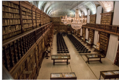
2. Biblioteca Nazionale Braidense sala Maria Teresa