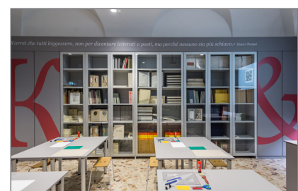
9. Il nuovo spazio educativo all'interno della Biblioteca Nazionale Braidense